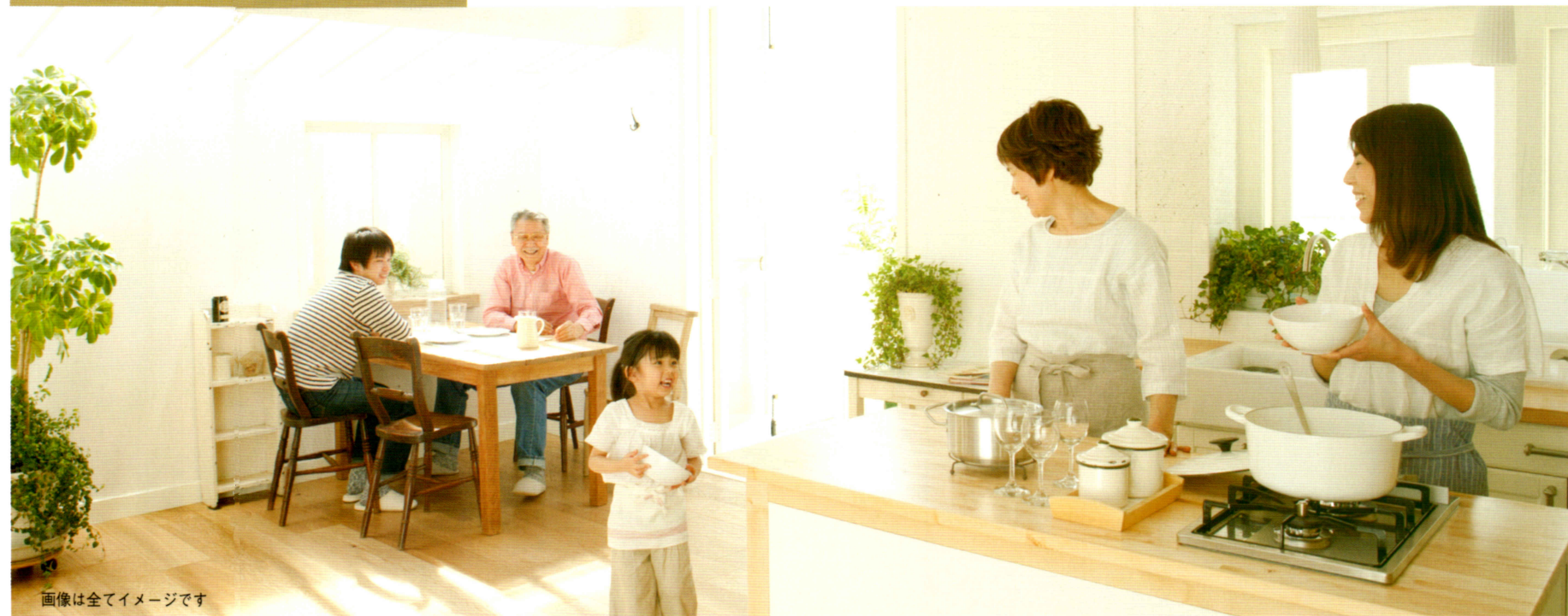
画像は全てイメージです